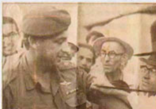
זבולוני ז"ל (מימין) במהלך הנחת תפילין לאריאל שרון בכותל המערבי, לאחר מלחמת ששת הימים. התמונה נרמזה לקידוש שם שמים בעולם כולו

"בעכו כבר השיגו את מבוקשם וסגן ראש העיר הערבי נתן את הסכמתו לנושא ואף שלח מכתב אישי אל מנהלי בתי הספר הערביים ובו בקשה לקבל בסבר פנים יפות את חסידי חב"ד - כך מוסר 'כפר חב"ד', בטאון חסידי לובאביץ'".